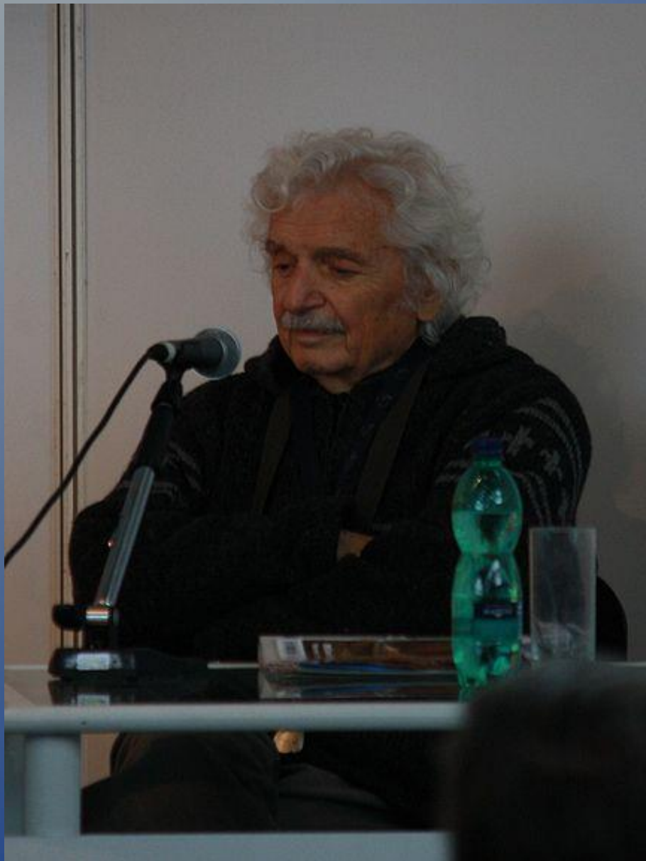
Obr.3 Zdeňek Svěrák