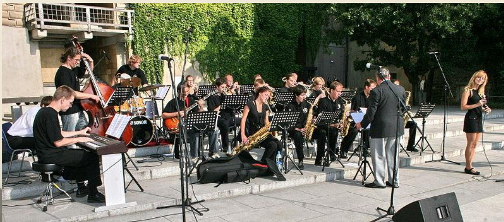
Vystoupení studentů v rámci hudebního festivalu Jazz na Hradě