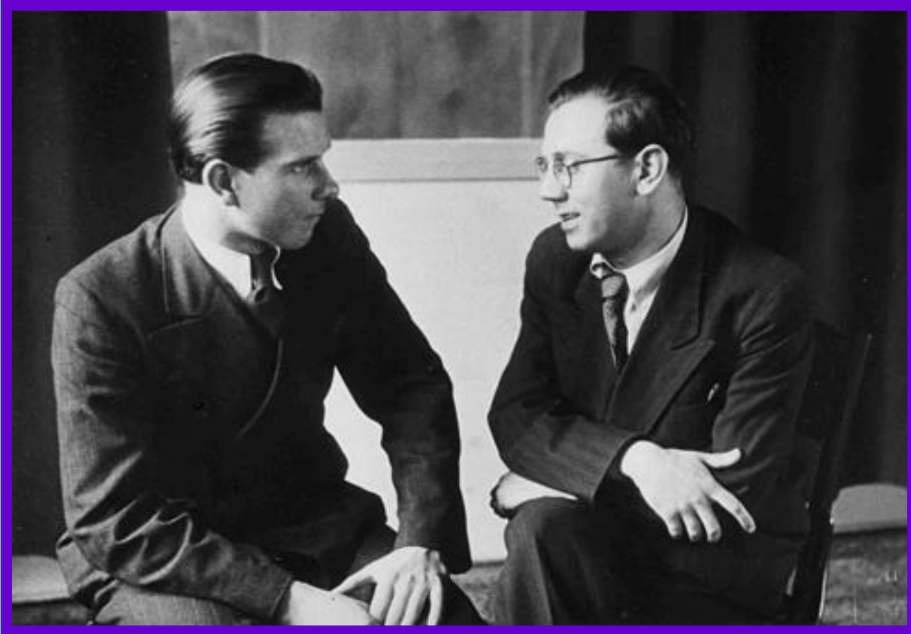
Jaroslav Ježek (na snímku vpravo)