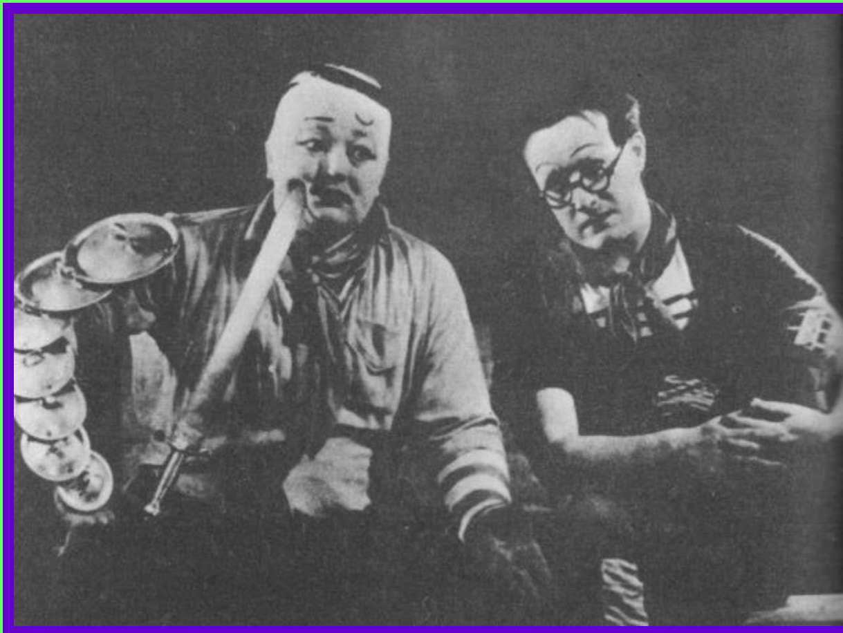
Jiří Voskovec a Jan Werich v divadelní roli