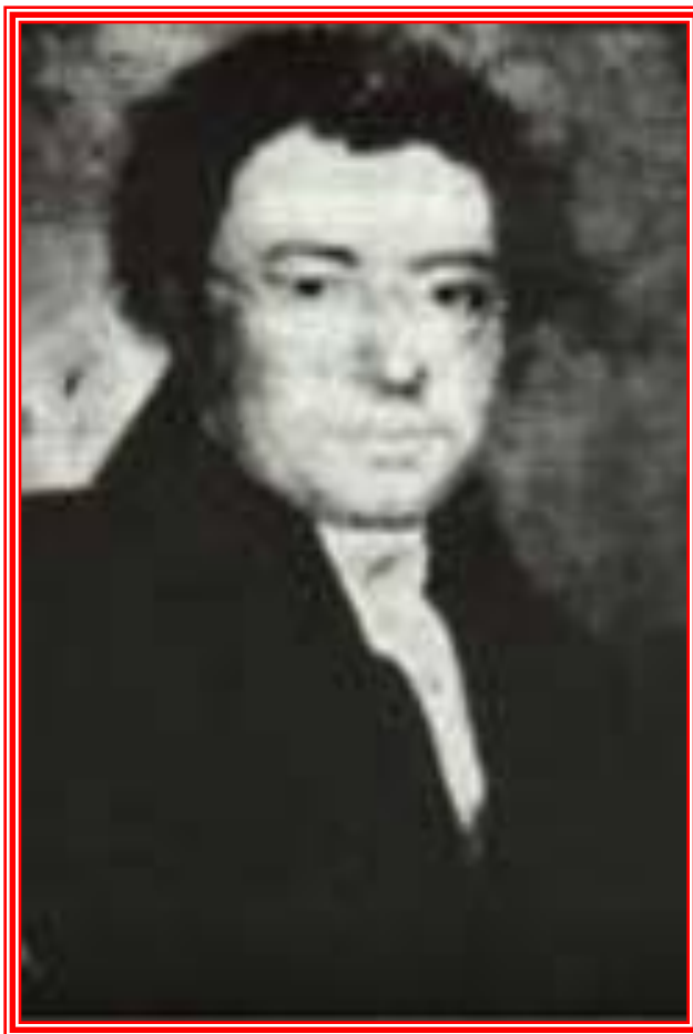
Adam Michna z Otradovic – varhaník z Jindřichova Hradce