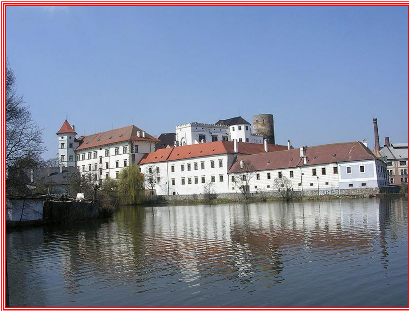
Jindřichův Hradec – rodiště Adama Michny