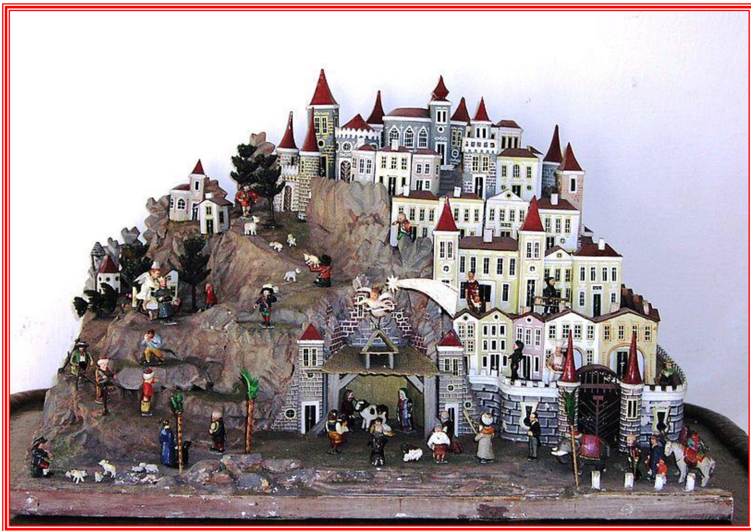
Jesličky – nikdy zde nechybí pastýři.