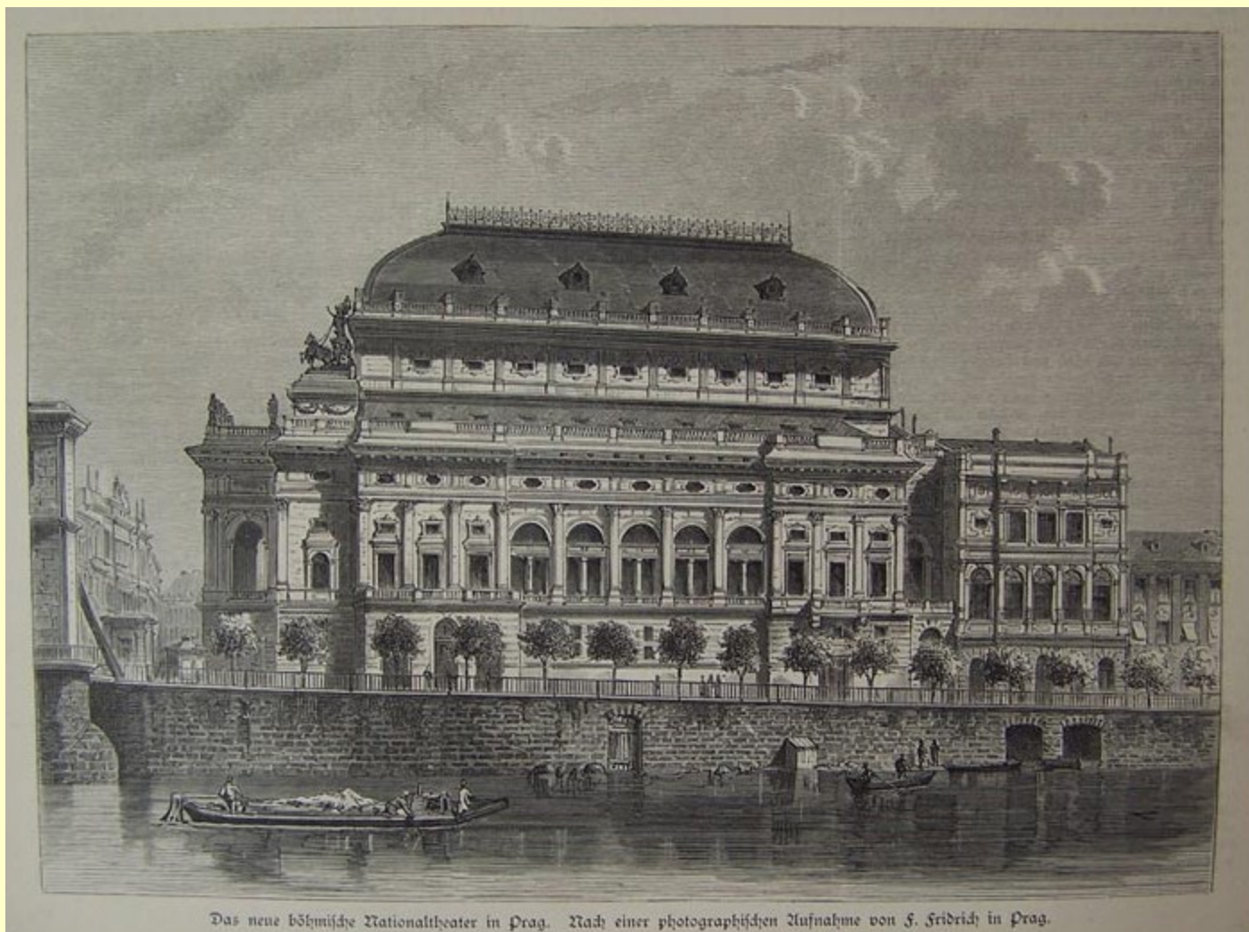
Das neue böhmische Nationaltheater in Prag. Nach einer photographischen Aufnahme von J. Fridrich in Prag.

Národní divadlo v Praze, dřevořezba z roku 1881.