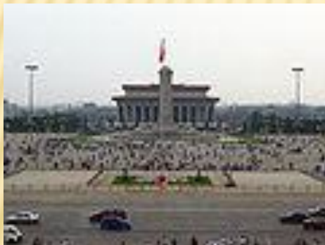
Náměstí Nebeského klidu