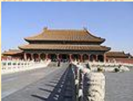
Palác Nebeského klidu