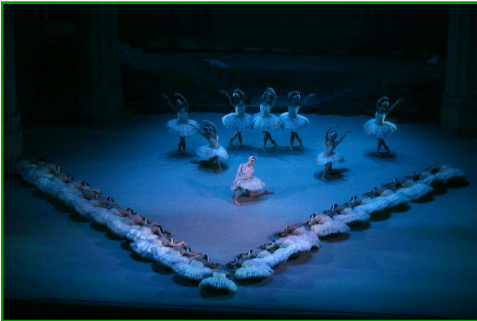
Balet Labutí jezero