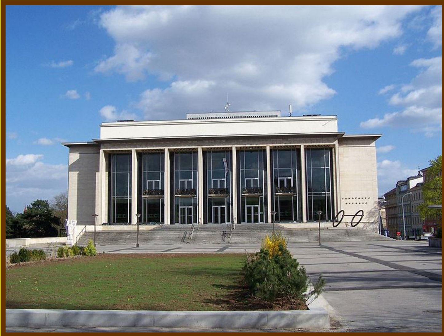
Janáčkovo divadlo v Brně