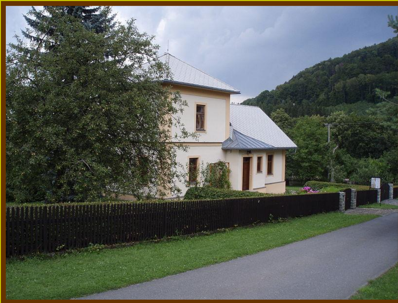
Rodný dům Leoše Janáčka v Hukvaldech