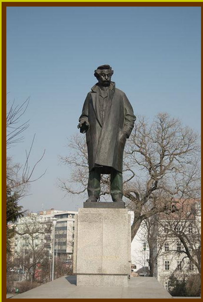
Socha L.Janáčka v Brně