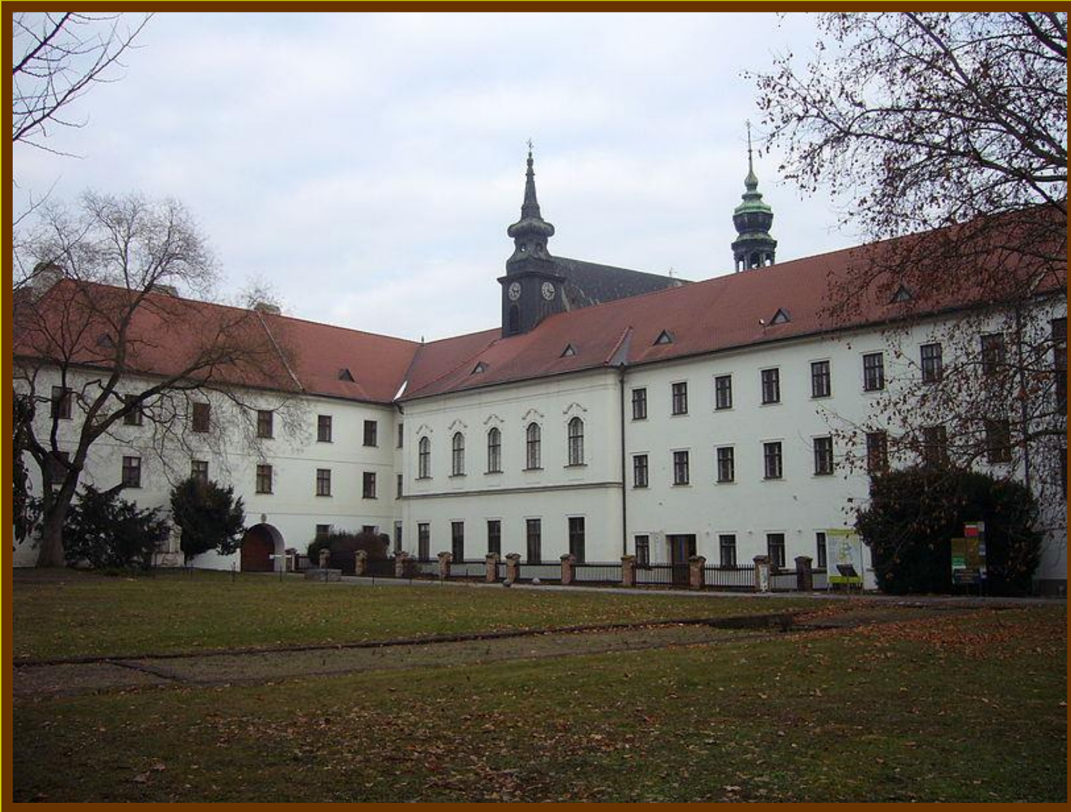
Starobrněnský klášter, kde Janáček trávil své mládí v chlapeckém pěveckém sboru.