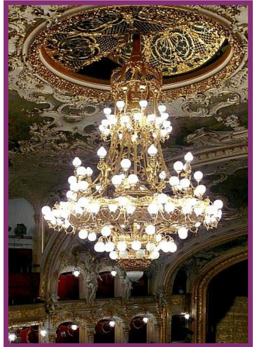
Hlavní lustr Státní opery v Praze 2