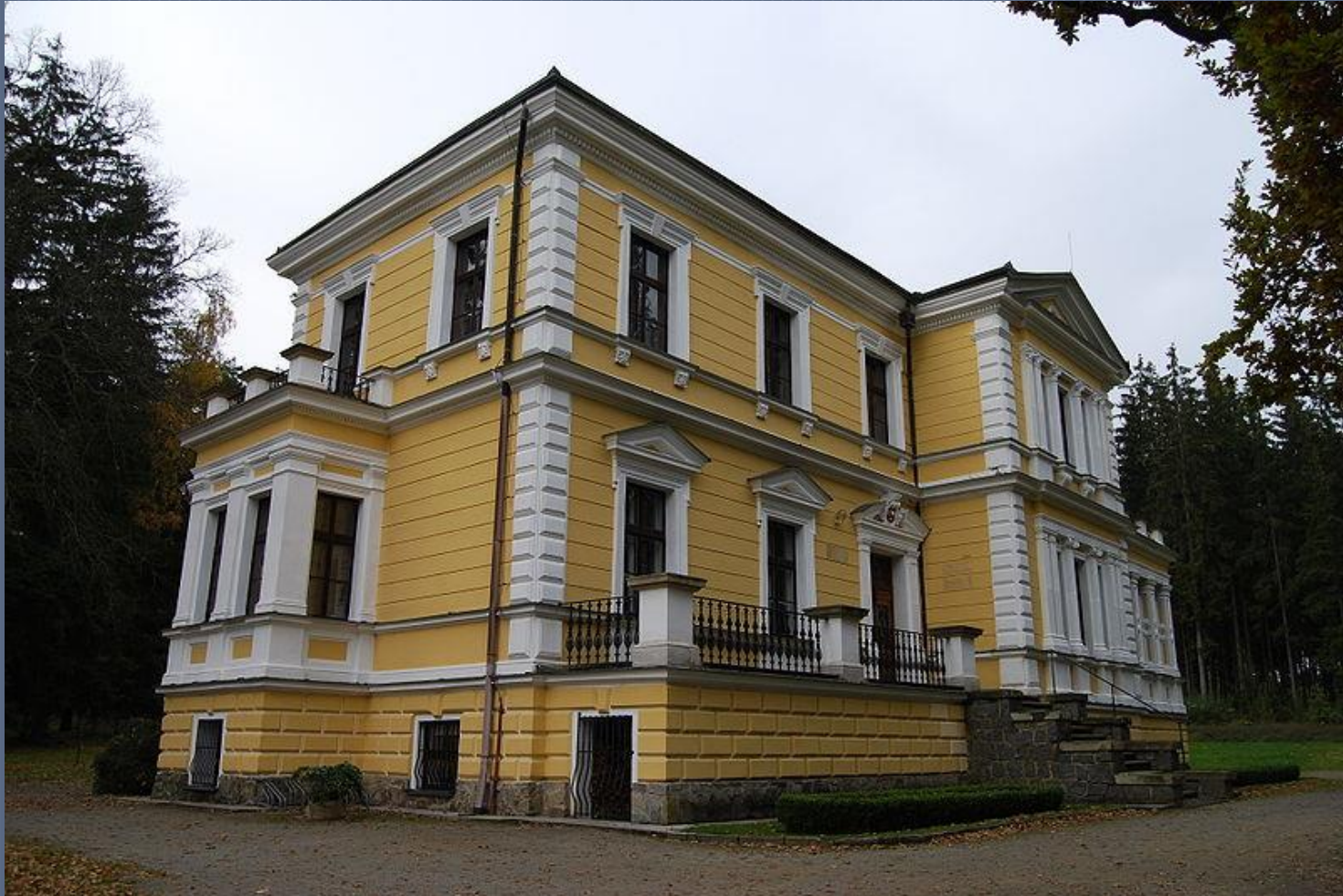
Zámek ve Vysoké u Příbrami Zde složil A. Dvořák např. Rusalku