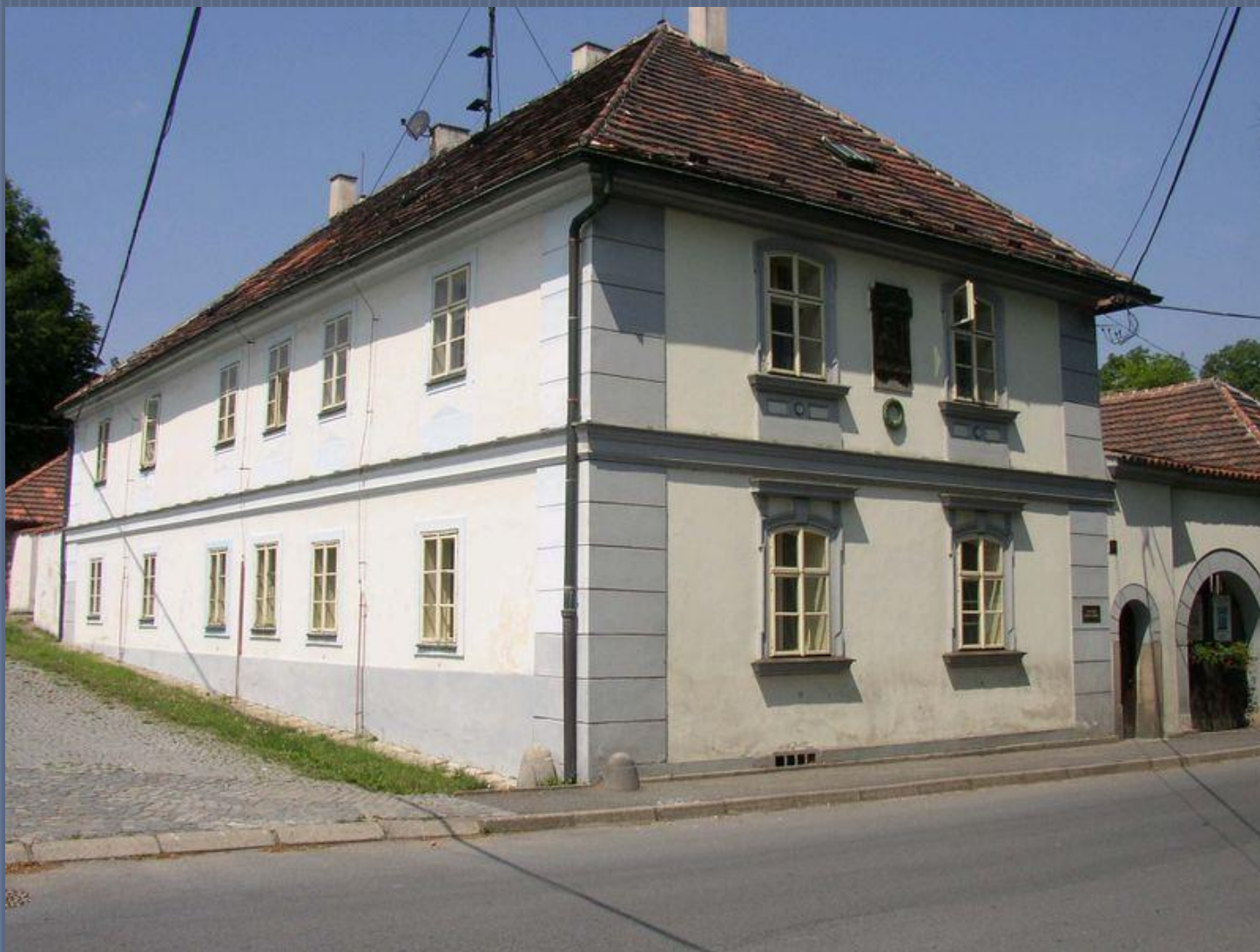
Rodný dům Antonína Dvořáka v Nelahozevsi